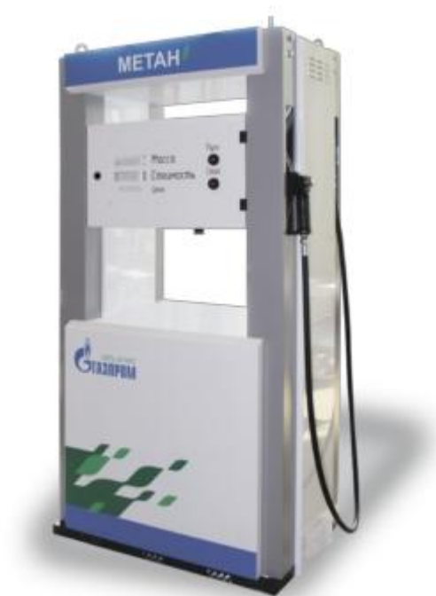
Рисунок 1 - Общий вид колонок заправочных для сжатого природного газа Эталон-К